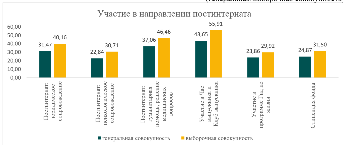
Рисунок 4. Участие выпускников в программах постинтернатной поддержки и сопровождения (генеральная/выборочная совокупность)

Таким образом, комплексная поддержка фонда «Дети наши» — от наставничества и персонального сопровождения до материальной и юридической помощи — является важным фактором успешной адаптации и становления выпускников во взрослой жизни.