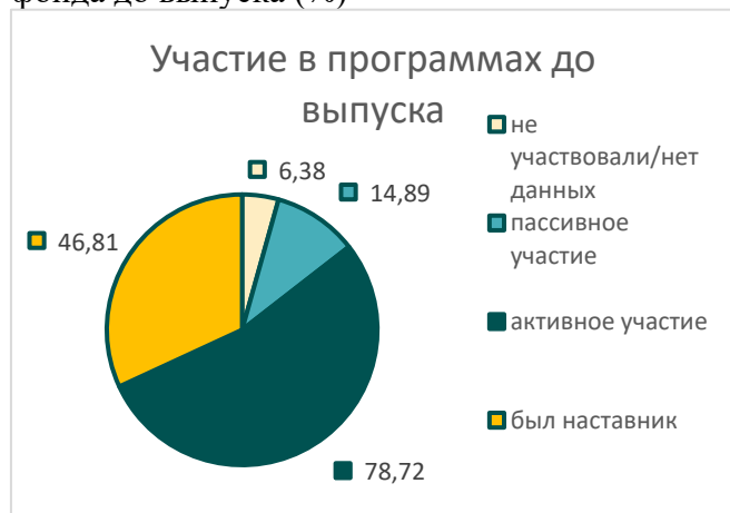
Рисунок 9. Группа А: участие в программах фонда до выпуска (%)