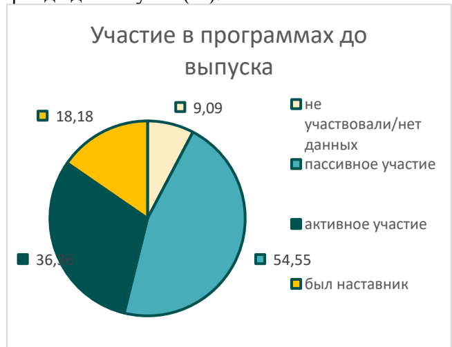
Рисунок 15. Группа С: участие в программах фонда до выпуска (%).