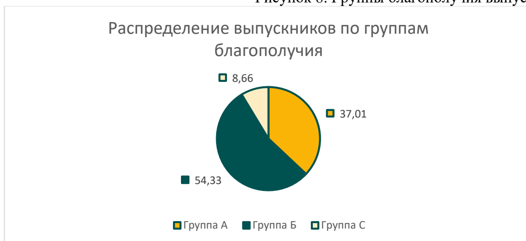
Рисунок 8. Группы благополучия выпускников (%).

На основе данной классификации мы рассмотрели уровень удовлетворенности жизнью, учебной работой и получили следующие результаты: