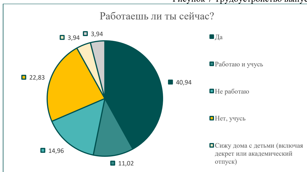
Рисунок 7 Трудоустройство выпускников (%)

Неофициальное трудоустройство большинства выпускников детских домов свидетельствует о ряде важных факторов. В нашем опросе формат трудоустройства распределился следующим образом: