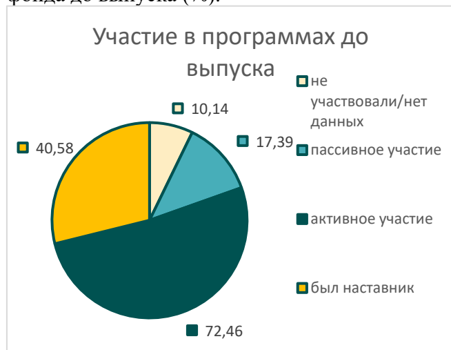
Рисунок 12 Группа Б: участие в программах фонда до выпуска (%).