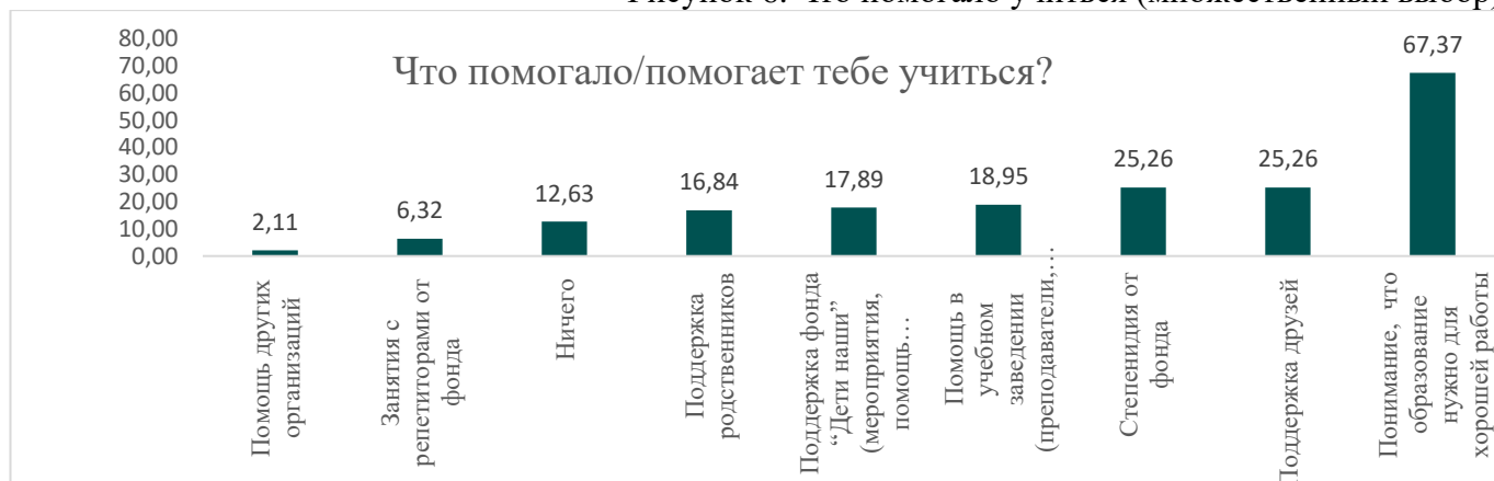
Рисунок 6. Что помогало учиться (множественный выбор)

Как мы видим, значение различных форм поддержки от фонда «Дети наши» стоит в одном диапазоне, что и помощь родственников, и помощь специалистов учебного заведения. Эти данные свидетельствуют о том, что фонд «Дети наши» оказывает значимую поддержку, которая сопоставима с помощью родственников и специалистов учебных заведений. Комплексная поддержка фонда способствует качественному образовательному процессу и развитию выпускников, помогая им успешно адаптироваться и совершать осознанный выбор в своей образовательной и профессиональной траектории.