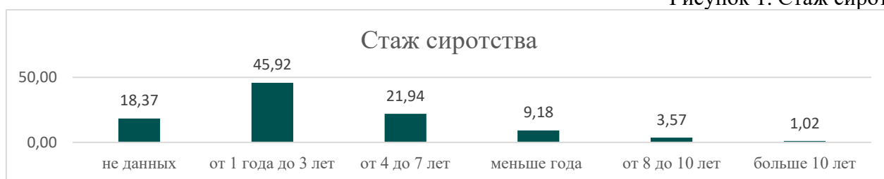
Рисунок 1. Стаж сиротства

Специалисты фонда начинают работать с детьми школьного возраста. Ребята участвуют в проектах фонда осознанно и по собственному желанию. Такая работа способствует повышению мотивации к учебе, развитию социальных и коммуникативных навыков, а также помогает детям преодолевать стресс и адаптироваться к образовательной среде. Цель вовлечения детей в проекты и